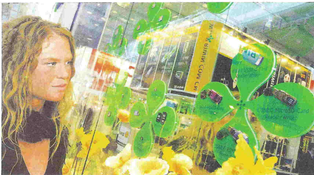
Auf der CeBIT: Wer mit seiner Messebeteiligung reüssieren will, braucht mehr als hübsche Hostessen und Blumen

Im Bereich der Business-to-Business-Kommunikation werden durchschnittlich knapp 40 Prozent des Etats für die Beteiligung an Messen ausgegeben. Nach einer Befragung des Ausstellungs- und Messe-Ausschusses der Deutschen Wirtschaft (AUMA) unter 500 Unternehmen ist für 81 Prozent die Messe die wichtigste Kommunikationsmaßnahme. Wenn dem so ist, wird dann auch der Erfolg dieser bedeutendsten Marketingaktion gemessen?